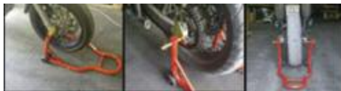
ΑΝΥΨΩΤΙΚΟ ΤΡΟΧΩΝ ΜΟΤΟΣΥΚΛΕΤΑΣ (62-17-000059)