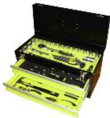
ΕΡΓΑΛΕΙΟΦΟΡΟΣ DYN 2 ΣΥΡΤΑΡΙΑ - 69 ΕΡΓΑΛΕΙΑ 510x250x220 χιλ. (62-17-000043)