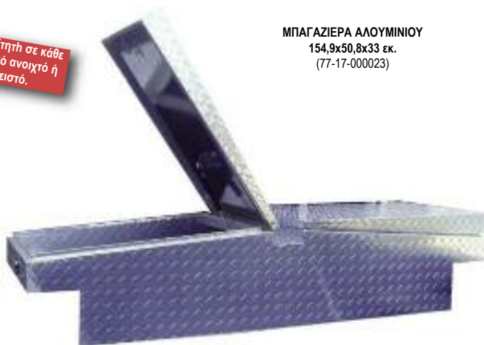
ΜΠΑΓΑΖΙΕΡΑ ΑΛΟΥΜΙΝΙΟΥ 154,9x50,8x33 εκ. (77-17-000023)

Απαραίτητη σε κάθε φορτηγό ανοιχτό ή κλειστό.