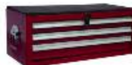
ΕΡΓΑΛΕΙΟΦΟΡΟΣ 3 ΣΥΡΤΑΡΙΑ ΕΠΙΚΑΘΗΜΕΝΟΣ 680x313x253 χιλ. (62-17-000004)

Συνδυάζονται με τον εργαλειοφόρο (κωδ. 62-17-002005)