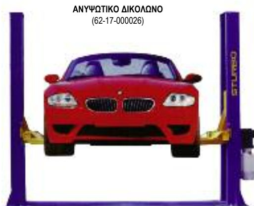
ΑΝΥΨΩΤΙΚΟ ΔΙΚΟΛΩΝΟ (62-17-000026)