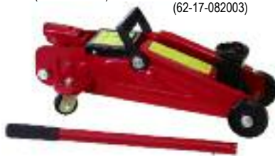
ΚΑΡΟΤΣΟΓΡΥΛΟΣ ΣΕ ΒΑΛΙΣΤΑ (62-17-082003)