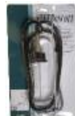
ΣΤΗΘΟΣΚΟΠΙΟ ΜΗΧΑΝΙΚΩΝ (66-02-000033)

Απαραίτητη σε κάθε φορτηγό ανοιχτό ή κλειστό.