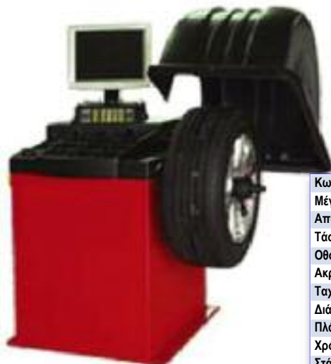
ΖΥΓΟΣΤΑΘΜΙΣΗ ΕΠΙΒΑΤΙΚΩΝ (62-17-000038)