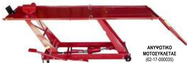
ΑΝΥΨΩΤΙΚΟ ΜΟΤΟΣΥΚΛΕΤΑΣ (62-17-000035)