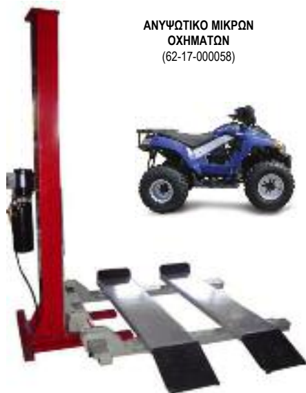
ΑΝΥΨΩΤΙΚΟ ΜΙΚΡΩΝ ΟΧΗΜΑΤΩΝ (62-17-000058)