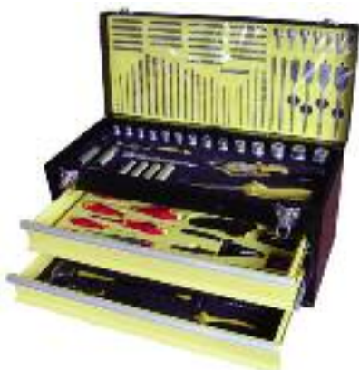
ΕΡΓΑΛΕΙΟΦΟΡΟΣ DYN 2 ΣΥΡΤΑΡΙΑ - 15 ΕΡΓΑΛΕΙΑ 510x250x220 χιλ. (62-17-000044)