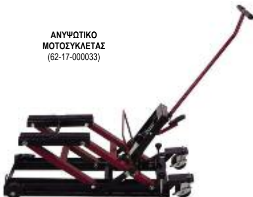
ΑΝΥΨΩΤΙΚΟ ΜΟΤΟΣΥΚΛΕΤΑΣ (62-17-000033)