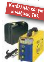
INVERTER GYSMI E160 (66-01-016002)