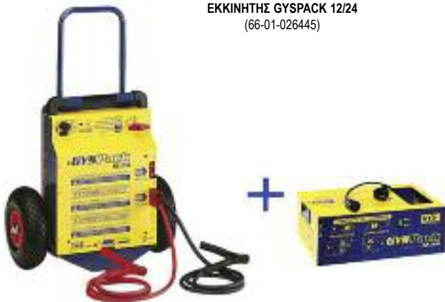
ΕΚΚΙΝΗΤΗΣ GYSPACK 12/24 (66-01-026445)

GYSPACK 12.24. Εκκινήτης 12 και 24 V. Συμπεριλαμβάνεται ξεχωριστός φορτιστής (χαρακτηριστικής καμπύλης IUoU) για την φόρτιση των μπαταριών του GYSPACK 12.24