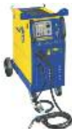
MIG MAG MONOMIG 165/4 (66-01-017177)