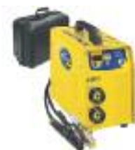
INVERTER GYSMI 200 CEL FV (66-01-030862)