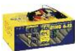
ΦΟΡΤΙΣΤΗΣ INVERTER 40HF 12/24V (66-01-029248)