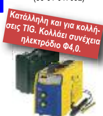
INVERTER 206FV (66-01-030817)