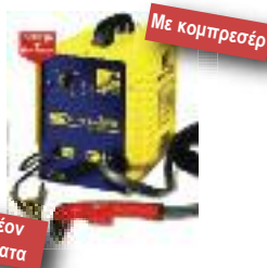
ΜΗΧΑΝΗ ΚΟΠΗΣ ΜΕ ΠΛΑΣΜΑ GYS CUTTER 21 (66-01-030961)