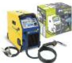
SMART MIG 162 (66-01-133450)