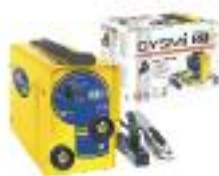
INVERTER 2500 (66-01-013025)