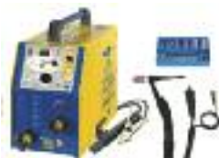
INVERTER TIG 208 AC/DC +SR20HD (66-01-011816)