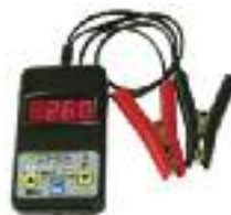
ΔΟΚΙΜΑΣΤΙΚΟ ΜΠΑΤΑΡΙΩΝ BT111 (66-01-055155)

Ελέγχει την κατάσταση της μπαταρίας, του δυναμό και της μίζας.