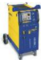
MIG MAG TRIMIG 385/4S, 380V (66-01-033450)

ΤΡΙΦΑΣΙΚΗ ΜΗΧΑΝΗ ΣΥΡΜΑΤΟΣ Αυτή η υψηλής απόδοσης μηχανή είναι ιδανική για εργασίες συντήρησης.