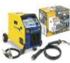
MIG MAG MONOMIG 200-2CS (66-01-020351)