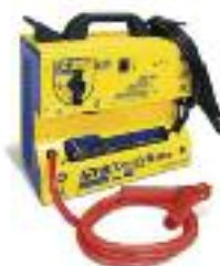
ΕΚΚΙΝΗΤΗΣ GYSPACK 810 (66-01-026278)