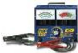
ΔΟΚΙΜΑΣΤΙΚΟ ΜΠΑΤΑΡΙΩΝ TBP500 (66-01-055148)

Ελέγχει την κατάσταση της μπαταρίας, του δυναμό και της μίζας.