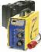
INVERTER 251 380V (66-01-010024)