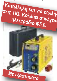
INVERTER 251 TRI ΜΕ ΚΛΩΒΟ ΠΡΟΣΤΑΣΙΑΣ 380V (66-01-010031)