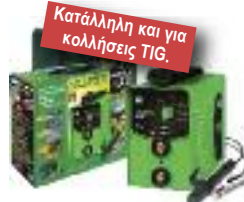
INVERTER 5000 (66-01-005000)