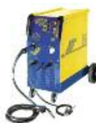
MIG MAG TRIMIG 170-4 (66-01-017597)