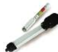
ΠΥΚΝΟΜΕΤΡΟ ΜΠΑΤΑΡΙΩΝ ΚΑΙ ΑΝΤΙΨΥΚΤΙΚΟΥ (66-01-054103)