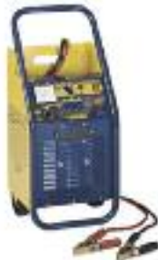
ΦΟΡΤΙΣΤΗΣ-ΕΚΚΙΝΗΤΗΣ GYSTART 1224T (66-01-025394)