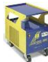
ΚΑΡΟΤΣΙ ΜΕΤΑΦΟΡΑΣ ΜΕ ΨΥΞΗ ΓΙΑ EASY TIG (66-01-041370)

Σύστημα συγκόλλησης με τη μέθοδο TIG με σύρμα για εφαρμογές με απαιτήσεις. Αυξάνει τον κύκλο των συνεργαζόμενων ηλεκτροσυγκολλήσεων λόγω της ψύξης με νερό (εφ' όσον συνεργάζονται). Συνεργάζεται με τα inverter TIG 137HF, 160HF, 167HF και 180AC/DC. Είναι απαραίτητο το καρότσι μεταφοράς με ψύξη (κωδ. 66-01-041370). Μήκος τσιμπιδας 4μ. Παραδίδεται με ράουλα Φ1,0 και Φ1,2 χιλ. Δέχεται σύρμα σε καρούλια 15 κιλών.