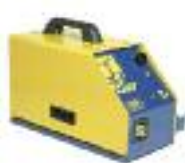
ΤΡΟΦΟΔΟΤΗΣ WF 212 (66-01-017849)

Συνεργάζεται με μηχανές MAGYS 263, 410 GENEYS 263SF, 510SF