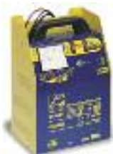
ΦΟΡΤΙΣΤΗΣ-ΕΚΚΙΝΗΤΗΣ GYSTART 724E (66-01-025356)