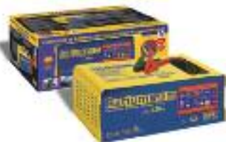
ΦΟΡΤΙΣΤΗΣ BATIUM 25-24 (66-01-024533)