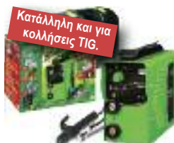
INVERTER 4000 (66-01-013056)