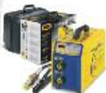
INVERTER 250 TRI 380V (66-01-000191)