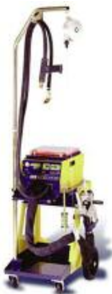
ΗΛΕΚΤΡΟΠΟΝΤΑ GYSPOT INVERTER BPLX (66-01-019461)