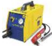
ΜΗΧΑΝΗ ΚΟΠΗΣ ΜΕ ΠΛΑΣΜΑ GYS CUTTER 31FV (66-01-030916)