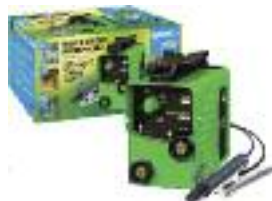
INVERTER 3200 (66-01-013032)