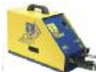
ΤΡΟΦΟΔΟΤΗΣ WF 344W ΥΔΡΟΨΥΚΤΟΣ (66-01-017863)

Συνεργάζεται με μηχανές MAGYS 263, 410 GENEYS 263SF, 510SF