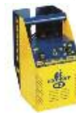
ΗΛΕΚΤΡΟΣΥΓΚΟΛΛΗΣΗ ΧΑΛΚΟΥ GYS EXPERT 42 (66-01-000042)