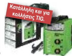
INVERTER GYSMI 130P (66-01-000357)