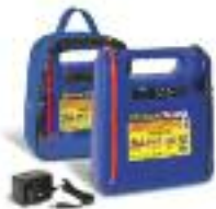
ΕΚΚΙΝΗΤΗΣ GYSPACK AIR400+ΚΟΜΠΡΕΣΕΡ (66-01-026322)