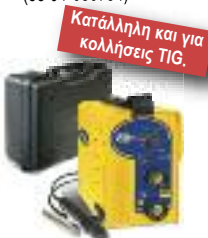
INVERTER 135 (66-01-030237)