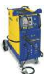
MIG MAG DUOMIG AUTO (66-01-017979)

ΑΠΑΡΑΙΤΗΤΗ ΣΤΟΥΣ ΦΑΝΟΠΟΙΟΥΣ Η μόνη με 2 τσιμπίδες!