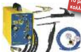
INVERTER TIG 180 AC/DC (66-01-015661)

Το μόνο κατάλληλο για κολλήσεις αλουμινίου.