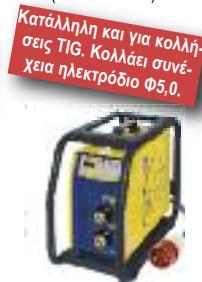
INVERTER MASTER 200FV (66-01-030787)