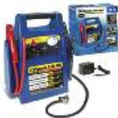
ΕΚΚΙΝΗΤΗΣ GYSPACK 610 (66-01-026261)