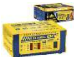
ΦΟΡΤΙΣΤΗΣ WATTMATIC 180 (66-01-024961)