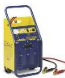
ΦΟΡΤΙΣΤΗΣ-ΕΚΚΙΝΗΤΗΣ GYS PROSTART 430 (66-01-025219)