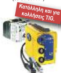
INVERTER 160P (66-01-030077)