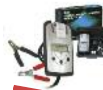
ΔΟΚΙΜΑΣΤΙΚΟ ΜΠΑΤΑΡΙΩΝ BT301 DHC ΜΕ ΕΚΤΥΠΩΤΗ (66-01-055186)

Παραδίδεται με καταγραφικό, 4 μπαταρίες, 2 ρόλλους χαρτιού, θήκη μεταφοράς. Μενού σε 7 γλώσσες.