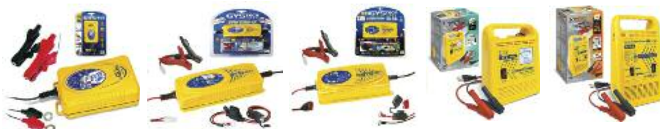
ΦΟΡΤΙΣΤΗΣ GYS TCB 120 (66-01-000120)

Ο GYSTECH μπορεί να φορτίσει έως 100% ή να συντηρήσει όλους τους τύπους μπαταριών μολύβδου (με υγρό ή ηλεκτρολύτη γέλης) χωρίς επιτήρηση. Προστατεύουν τα ηλεκτρονικά και εγγυώνται μια ασφαλή χρήση (προστασία έναντι βραχυκυκλώματος/αναστροφής πολικότητας/υπερφόρτισης). GYSTECH 3800/7000 (προστασία IP65) κατάλληλος για χρήση σε πολύ υγρό περιβάλλον, συνεργεία αυτοκινήτων κλπ. GYSTECH 750 (6/12V) ιδανικός για μοτοσυκλέτες, σκούτερ, γουρούνες, τζετ σκι, τρακτέρ κοπής χλόης κλπ. GYSTECH 3800 (12V) ιδανικός για μοτοσυκλέτες, αυτοκίνητα, αυτοκινούμενα χλοοκοπτικά κλπ. GYSTECH 7000 (12/24V) ιδανικός για αυτοκίνητα, ελκυστήρες, τροχόσπιτα, σκάφη αναψυχής κλπ.