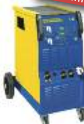
EASY TIG (βατοράκι για κόλληση TIG με σύρμα) (66-01-017870)