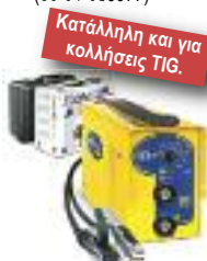
INVERTER 200P (66-01-030794)