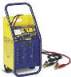
ΦΟΡΤΙΣΤΗΣ-ΕΚΚΙΝΗΤΗΣ GYSTART 924.230 (66-01-025363)