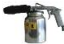
ΠΙΣΤΟΛΙ ΑΜΜΟΒΟΛΗΣ ΜΕ ΣΩΛΗΝΑ 3Μ (95-17-000032)