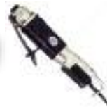
ΓΡΑΣΣΑΔΟΡΟΣ ΑΕΡΟΣ 500cc (66-05-000026)