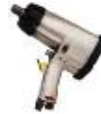
ΑΕΡΟΚΛΕΙΔΟ ΜΑΚΡΥ (66-05-007355)