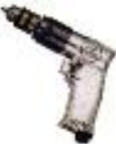
ΑΕΡΟΚΑΤΣΑΒΙΔΟ Δ-Α (66-05-000017)