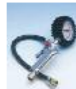
ΤΣΟΚ Φ8 ΦΟΥΣΚΩΜΑΤΟΣ ΕΛΑΣΤΙΚΩΝ (95-17-000036)