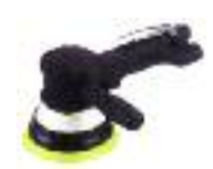
ΓΩΝΙΑΚΟΣ ΑΕΡΟΤΡΟΧΟΣ (66-05-000033)