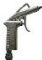
ΠΙΣΤΟΛΙ ΦΥΣΗΜΑΤΟΣ ΜΑΚΡΥ 270MM, ΠΛΑΣΤΙΚΟ ABS (95-17-000007)