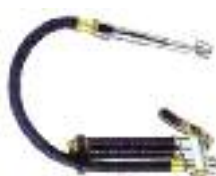
ΠΙΣΤΟΛΙ ΑΕΡΟΜΕΤΡΟ ΜΕ ΜΑΝΟΜΕΤΡΟ Β.Τ. (95-17-004547)