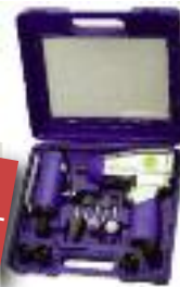
ΑΕΡΟΚΛΕΙΔΟ + ΑΕΡΟΜΕΤΡΟ ΣΕΤ (66-05-000086)

Περιέχει: Αερόκλειδο 1/2, αεροτροχό 1/4, καρυδάκια αέρος 17-19-21 χιλ., 5 σμυριδοτροχούς με στέλεχος, 2 κλειδιά, 1 μαστό. Σε βαλίτσα.