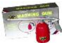
ΠΙΣΤΟΛΙ ΠΕΤΡΕΛΑΙΟΥ ΜΕΤΑΛΛΙΚΟ ΔΟΧΕΙΟ (95-17-000040)