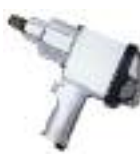
ΑΕΡΟΚΛΕΙΔΟ ΣΕΤ 17 ΤΜΧ (66-05-000058)

Περιέχει: Καρυδάκια 9-10-11-13-14-17-19-22-24-27. Σε βαλίτσα.