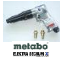
ΑΕΡΟΚΟΠΙΔΟ ΣΕΤ 5 ΤΜΧ ΜΕ ΤΑΧΕΙΑ ΕΜΠΛΟΚΗ ΚΟΠΙΔΙΟΥ (66-05-000059)