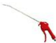
ΠΙΣΤΟΛΙ ΦΥΣΗΜΑΤΟΣ ΚΟΝΤΟ (95-17-000035)