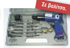
ΑΕΡΟΚΟΠΙΔΟ ΜΗΣ 450 ΣΕΤ ΜΕ 5 ΒΕΛΟΝΟΚΟΠΙΔΑ (94-05-000150)