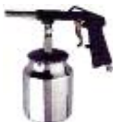
ΠΙΣΤΟΛΙ ΦΥΣΗΜΑΤΟΣ ΚΟΝΤΟ ΑΛΟΥΜΙΝΙΟΥ (95-17-003786)