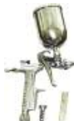
ΜΠΕΚ ΑΝΤΑΛΛΑΚΤΙΚΟ ΠΙΣΤΟΛΙΟΥ ΒΑΦΗΣ Φ1,5 (95-17-000003)