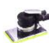
ΤΡΙΒΕΙΟ ΑΕΡΟΣ ΕΚΚΕΝΤΡΟ + ΑΠΟΡΡΟΦΗΣΗ (66-05-000019)