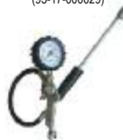
ΠΙΣΤΟΛΙ ΑΕΡΟΜΕΤΡΟ Φ63 ΜΟΝΩΝ ΕΛΑΣΤΙΚΩΝ (95-17-000038)