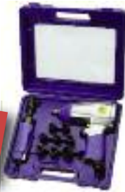
ΑΕΡΟΚΛΕΙΔΟ + ΑΕΡΟΤΡΟΧΟΣ ΣΕΤ (66-05-000088)

Περιέχει: Αερόκλειδο 1/2, καστανία 1/4, καρυδάκια αέρος 9-10-11-13-14-17-19-21 χιλ., 1 μαστό. Σε βαλίτσα.