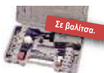
ΣΕΓΑ ΑΕΡΟΣ (66-05-000021)