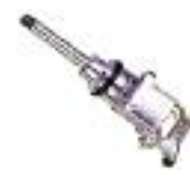
ΑΕΡΟΚΑΣΤΑΝΙΑ ΣΕΤ (66-05-000025)

Περιέχει: καρυδάκια 10-11-12-13-14-17-19 χιλ., 3 προσαρμοστές.