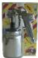
ΠΙΣΤΟΛΙ ΒΑΦΗΣ ΚΔ ΕΙΝHELL (75-20-000016)