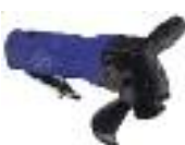
ΤΡΙΒΕΙΟ ΑΕΡΟΣ (ΠΛΑΝΗ) (66-05-000005)