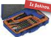
ΑΕΡΟΤΡΟΧΟΣ ΜΕ 16 ΕΞΑΡΤΗΜΑΤΑ (66-05-000018)