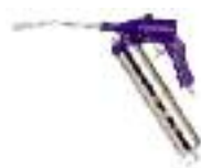
ΤΡΙΒΕΙΟ ΑΕΡΟΣ (66-05-000020)