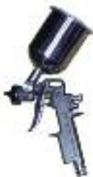
ΠΙΣΤΟΛΙ ΒΑΦΗΣ ΑΔ ΕΙΝHELL (75-20-000017)