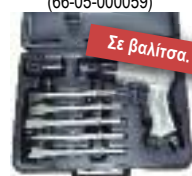
ΑΕΡΟΚΟΠΙΔΟ ΜΗΣ 315 ΣΕΤ, ΜΕ 5 ΒΕΛΟΝΟΚΟΠΙΔΑ (94-05-000149)