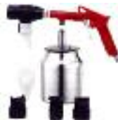
ΠΙΣΤΟΛΙ ΑΜΜΟΒΟΛΗΣ ΜΕ ΔΟΧΕΙΟ 1000cc Φ6 (95-17-000034)