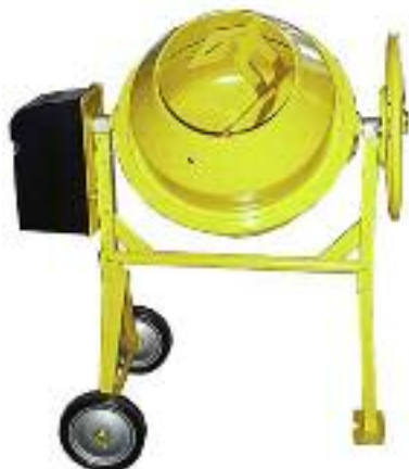
ΜΠΕΤΟΝΙΕΡΑ CM 180 (62-12-000180)