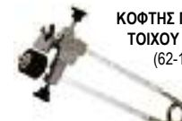
ΛΑΒΗ ΚΟΦΤΗ ΠΛΑΚΙΔΙΩΝ ΔΥΝ PRO (62-18-000012)