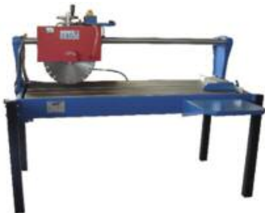
ΚΟΦΤΗΣ ΠΛΑΚΑΔΩΝ DYN (62-12-000250)