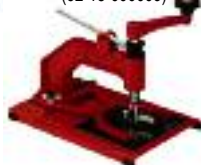
ΑΝΤΑΛΛΑΚΤΙΚΟ ΓΙΑ ΚΟΦΤΗ ΚΥΚΛΙΚΗΣ ΚΟΠΗΣ (62-18-000013)