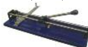
ΚΟΦΤΗΣ ΠΛΑΚΙΔΙΩΝ HOBBY (77-18-000005) (77-18-000006)