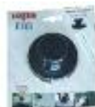
ΣΗΜΑΔΕΥΤΗΡΙ ΑΝΤΙΓΡΑΦΗΣ ΠΛΑΚΙΔΙΩΝ (66-18-000018)