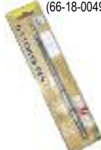
ΚΟΦΤΗΣ ΠΛΑΚΙΔΙΩΝ ΣΤΥΛΟ ΜΕ ΔΙΧΑΛΑ (77-18-000013)