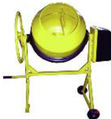
ΜΠΕΤΟΝΙΕΡΑ PCM 350 (62-12-000047)