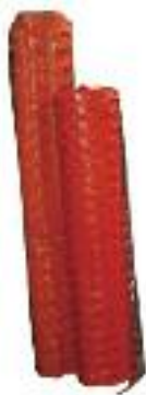
ΑΛΥΣΙΔΑ ΚΑΡΟΣΑΚΙ ΑΝΑΒΑΤΟΡΙΟΥ (61-05-000882)