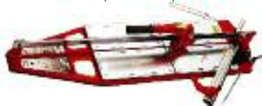
ΚΟΦΤΗΣ ΠΛΑΚΙΔΙΩΝ ΔΥΝ PRO (62-18-000004) (62-18-000005)