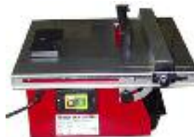
ΚΟΦΤΗΣ ΠΛΑΚΙΔΙΩΝ ΓΙΑ ΕΡΑΣΙΤΕΧΝΕΣ (62-05-000014)