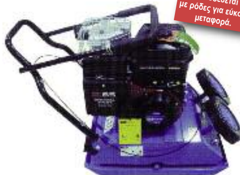
ΣΥΜΠΙΕΣΤΗΣ ΕΔΑΦΟΥΣ (62-12-000100)

Συνοδεύεται με ρόδες για εύκολη μεταφορά.