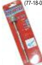
ΚΟΦΤΗΣ ΠΛΑΚΙΔΙΩΝ ΤΑΝΑΛΙΑ ΒΙΝΤΙ (77-18-000004)