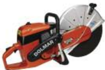
ΚΟΦΤΗΣ ΔΟΜΙΚΩΝ ΥΛΙΚΩΝ PC-8116 DOLMAR (69-05-000138)