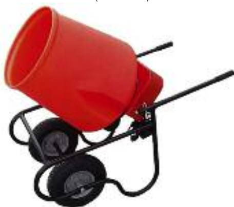
ΜΠΕΤΟΝΙΕΡΑ 180L (62-12-000109)