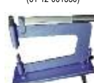
ΑΝΤΑΛΛΑΚΤΙΚΟ ΓΙΑ ΚΟΦΤΗ ΚΕΡΑΜΙΔΙΩΝ (61-12-006357)