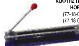
ΚΟΦΤΗΣ ΠΛΑΚΙΔΙΩΝ Τ. ΙΤΑΛΙΑΣ (77-18-000074) (77-18-000075)