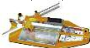
ΚΟΦΤΗΣ ΠΛΑΚΙΔΙΩΝ ΔΥΝ PRO (62-18-000049) (62-18-000014)