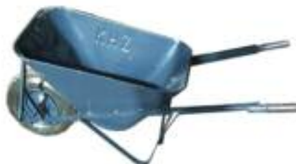
ΚΑΡΟΣΑΚΙ ΑΝΑΒΑΤΟΡΙΟΥ ΑΠΛΟ (61-05-000631)