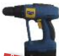
ΦΟΡΤΙΖΟΜΕΝΟ DYN 18V (66-05-000006)

Περιέχει: 6 τρυπάνια, 6 μύτες, προσαρμοστή, 2 μπαταρίες, φορτιστή 1 ώρας. Σε πρακτική βαλίτσα.