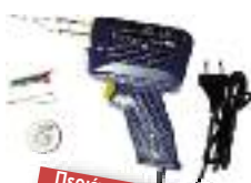
ΚΟΛΛΗΤΗΡΙ DYN ΑΥΤΟΜΑΤΟ (62-05-000156)

Περιέχει 2 επιπλέον μύτες, κόλληση, αλοιφή κολλήσεων. Σε πρακτική βαλίτσα.