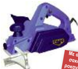
ΠΛΑΝΗ DYN (62-05-000088)

Με απορρόφηση και σακούλα συλλογής ροκανιδιών. Με οδηγό πλανίσματος.