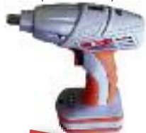
ΦΟΡΤΙΖΟΜΕΝΟ ΚΑΤΣΑΒΙΔΙ XLINE 9,6V (77-05-000186)