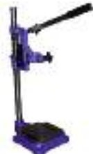
ΒΑΣΗ ΔΡΑΠΑΝΩΝ ΠΕΡΙΣΤΡΕΦΟΜΕΝΗ (77-05-220662)