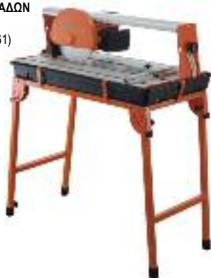
ΚΟΦΤΗΣ ΠΛΑΚΑΔΩΝ STAR 610 (80-05-057062)