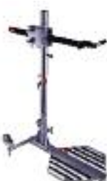
ΒΑΣΗ ΜΙΞΕΡ ΜΕ ΛΑΙΜΟ (80-05-038619)