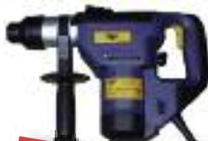
ΠΙΣΤΟΛΕΤΟ DYN SDS-plus ΠΕΡΙΣΤΡΟΦΙΚΟ ΚΡΟΥΣΤΙΚΟ Φ26 (62-05-000226)

Περιέχει: Βελόνι, κοπίδι, τρυπάνια 8,10,12x150 χιλ. Σε πρακτική βαλίτσα.