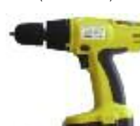
ΦΟΡΤΙΖΟΜΕΝΟ 14,4V ΚΙΤΡΙΝΟ (77-05-000079)

Περιέχει: 2 μπαταρίες, φορτιστή 1 ώρας. Σε πρακτική βαλίτσα.