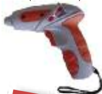
ΦΟΡΤΙΖΟΜΕΝΟ ΚΑΤΣΑΒΙΔΙ XLINE 9,6V ΛΙΘΙΟΥ ΜΕ ΦΩΣ (77-05-000187)