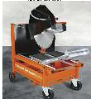
ΚΟΦΤΗΣ ΠΛΑΚΑΔΩΝ EXCALIBUR 1000 (80-05-057003)