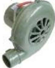
ΦΥΣΕΡΟ Φ60 T.Ισπανίας (66-01-004995)