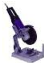
ΒΑΣΗ ΤΡΟΧΟΥ ΓΩΝΙΑΚΟΥ ΒΤ, Φ230 (66-05-005121)