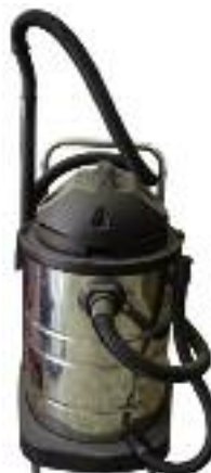
ΣΚΟΥΠΑ DYN ΣΤΕΡΕΩΝ ΚΑΙ ΥΓΡΩΝ ΜΕ ΡΟΔΕΣ (62-05-000349)