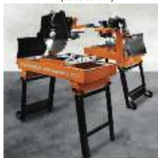
ΚΟΦΤΗΣ ΠΛΑΚΑΔΩΝ EXCALIBUR 700 (80-05-057002)