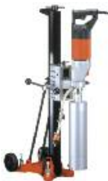
ΚΑΡΟΤΙΕΡΑ BARRACUDA 1800 (υγρής κοπής) (80-05-057011) + ΒΑΣΗ (80-05-056169)