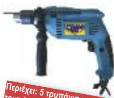
ΔΡΑΠΑΝΟ DYN 500W (62-05-000468)

Περιέχει: 5 τρυπάνια μπετού, 9 τρυπάνια HSS σιδήρου, 5 σμυριδοτροχούς με στέλεχος. Σε πρακτική βαλίτσα.