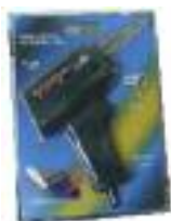
ΚΑΜΙΝΕΤΟ DYN ΘΕΡΜΟΥ ΑΕΡΑ (66-05-000055)