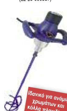
ΜΙΞΕΡ DYN ΗΛΕΚΤΡΟΝΙΚΗ ΡΥΘΜΙΣΗ ΣΤΡΟΦΩΝ (62-05-000387)

Ιδανικό για ανάμιξη χρωμάτων και κόλλα πλακιδίων.