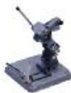
ΒΑΣΗ ΤΡΟΧΟΥ ΓΩΝΙΑΚΟΥ, Φ230 (77-05-005121)