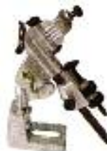
ΜΑΧΑΙΡΙΑ ΠΛΑΝΗΣ DYN 650W 82x2 (62-05-000132)