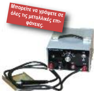
ΓΡΑΦΤΗΣ ΜΕΤΑΛΛΩΝ (61-05-004889)

Μπορείτε να γράψετε σε όλες τις μεταλλικές επιφάνειες.