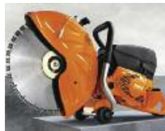
ΚΟΦΤΗΣ ΔΟΜΙΚΩΝ ΥΛΙΚΩΝ PIRANA (με δίσκο) (80-05-057030)