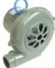
ΦΥΣΕΡΟ Φ60 (66-01-004994)