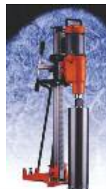
ΚΑΡΟΤΙΕΡΑ BARRACUDA 3200 (υγρής κοπής) (80-05-057016) + ΒΑΣΗ T250 (80-05-056170)