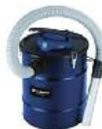
ΣΚΟΥΠΑ ΣΤΑΧΤΗΣ EINHELL (75-20-000023)