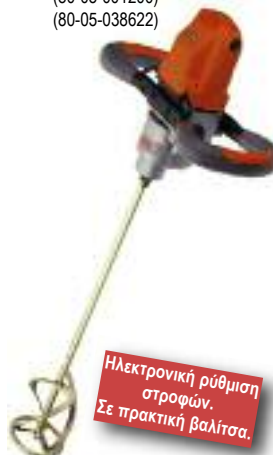
ΜΙΞΕΡ KDM (80-05-038511)