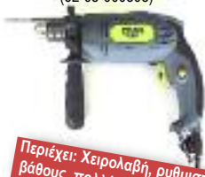
ΔΡΑΠΑΝΟ ΚΡΟΥΣΤΙΚΟ DYN ΗΛΕΚΤΡΟΝΙΚΟ Δ-Α (62-05-000308)

Περιέχει: Χειρολαβή, ρυθμιστή βάθους, πολλά χρήσιμα εξαρτήματα, πρακτική θήκη τρυπανιών στη χειρολαβή. Ηλεκτρονικό, με προρύθμιση στροφών. Σε πρακτική βαλίτσα.