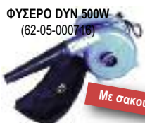
ΦΥΣΕΡΟ DYN 500W (62-05-000716)