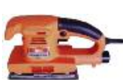
ΤΡΙΒΕΙΟ XLINE 180W (77-05-000192)