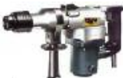
ΠΙΣΤΟΛΕΤΟ DYN SDS-plus ΠΕΡΙΣΤΡΟΦΙΚΟ ΚΡΟΥΣΤΙΚΟ Φ26 (62-05-000146)

Περιέχει: Βελόνι, κοπίδι, τρυπάνια 8,10,12x150 χιλ. Σε πρακτική βαλίτσα.