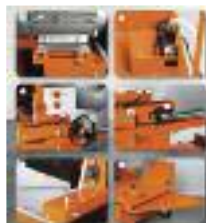
ΚΟΦΤΗΣ ΠΛΑΚΑΔΩΝ EXCALIBUR 400 (80-05-057000)