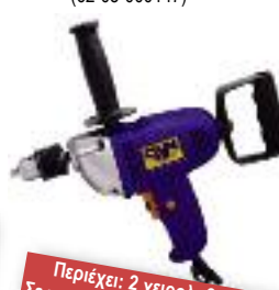
ΜΙΞΕΡ DYN ΗΛΕΚΤΡΟΝΙΚΟ Δ-Α (62-05-000147)

Περιέχει: 2 χειρολαβές. Σε πρακτική βαλίτσα. Ιδανικό για ανάμιξη χρωμάτων και κόλλα πλακιδίων.