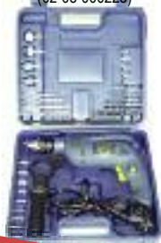
ΔΡΑΠΑΝΟ ΚΡΟΥΣΤΙΚΟ DYN ΗΛΕΚΤΡΟΝΙΚΟ Δ-Α (62-05-000225)

Περιέχει: πολλά χρήσιμα εξαρτήματα. Πρακτική θήκη τρυπανιών στη χειρολαβή. Σε πρακτική βαλίτσα.