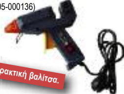
ΠΙΣΤΟΛΙ ΘΕΡΜΟΣΥΓΚΟΛΗΤΙΚΟ DYN (62-05-000136)