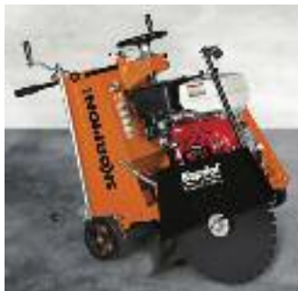
ΑΣΦΑΛΤΟΚΟΦΤΗΣ SKORPION (χωρίς δίσκο) (80-05-057050)