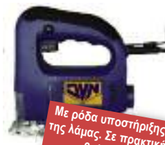
ΣΕΓΑ DYN (62-05-000071)

Με ρόδα υποστήριξης της λάμας. Σε πρακτική βαλίτσα.