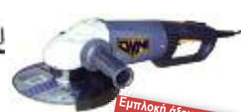
ΤΡΟΧΟΣ DYN 2350W (62-05-002350)

Εμπλοκή άξονα. Χειρολαβή. Κλειδί παξιμαδιού. Σε πρακτική βαλίτσα.