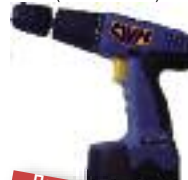
ΦΟΡΤΙΖΟΜΕΝΟ DYN 18V ΚΡΟΥΣΤΙΚΟ (62-05-000381)

Περιέχει: 6 τρυπάνια, 6 μύτες, προσαρμοστή, 2 μπαταρίες, φορτιστή 1 ώρας. Σε πρακτική βαλίτσα.